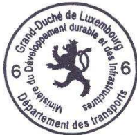
Marco FELTES Inspecteur Principal 1 er en rang

Pour le Ministre du Développement durable et des Infrastructures